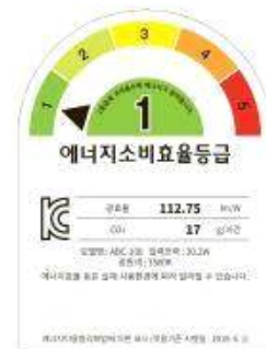
< 컨버터 외장형 LED램프 >