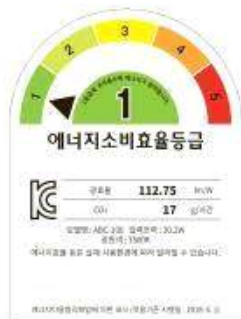
< 컨버터 내장형 LED램프 >