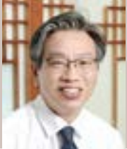
KOTRA 사장 유정열