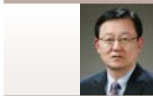
홍석우 (前 지식경제부 장관) 前 상지대학교 총장 前 KOTRA 사장