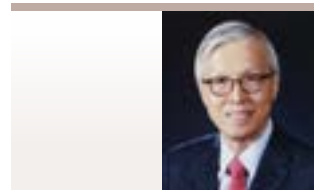
신각수 (前 외교통상부 차관) 前 주일대사