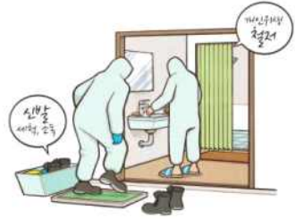
철새서식지에서 벗어날 시 신발세척·소독 및