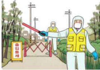
AI 발생으로 인한 '출입통제'지역 출입 금지