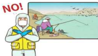
저수지, 하천 등 철새가 무리지어 있는 지역 출입 자체 및 AI 발생지역에서 낚시 금지

활형 후 물의 및 비닐로 밀봉 ※ 일회용 보호복(반역복 등) 착용 관장·일회용 물통 폐기, 나머지 폐기