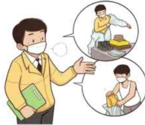
여벌의 활동복, 신발, 신발커버, 모자 등 준비