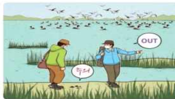
이동시에는 분변, 깃털 등을 밟지 않도록 주의 ※ 분변에 노출된 경우 즉시 비누와 물로 세정

활형 후 물의 및 비닐로 밀봉 ※ 일회용 보호복(반역복 등) 착용 관장·일회용 물통 폐기, 나머지 폐기