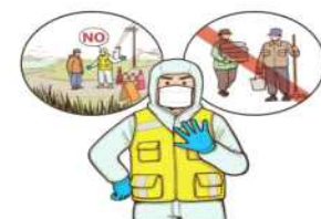
철새서식지 출입 후 가금(닭, 오리 등)농가 방문 금지 및 관련 종사자(농가 종사자, 사료·분뇨 운반자 등) 접촉 금지

볼과 비누로 손씻기 등 개인위생 철저 ※ 발열 등 인플루엔자 의심 증상 발생 시 관할지역 보건소에 즉시 신고