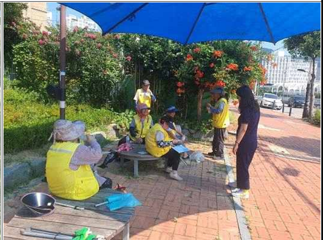
노인일자리 활동지원 사업