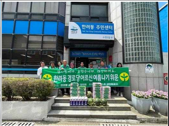
건강한 여름나기 후원물품 지원(지역사회보장협의체, 새마을회)