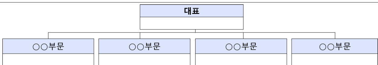
참여인력 조직구성 계획도