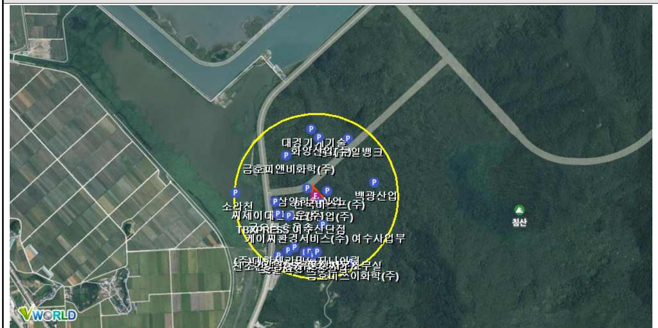
최대 영향범위 기준 반경 500m 내 환경 정보 위치도