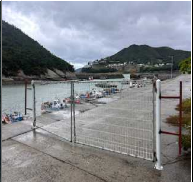
적치물 위치도 및 현장사진

위 장애물(적치물)은 어항의 효율적 이용을 저해하고 있으나 소유자가 이를 자진 제거하지 않아 어촌·어항법 제46조 및 같은 법 시행령 제41조항에 따라 위와 같이 직권으로 제거하고자 하오니, 이의가 있거나 문의사항이 있으신 분은 2024년 11월 3일까지 여수시 섬발전지원과(061-659-3979)로 연락하여 주시기 바랍니다.