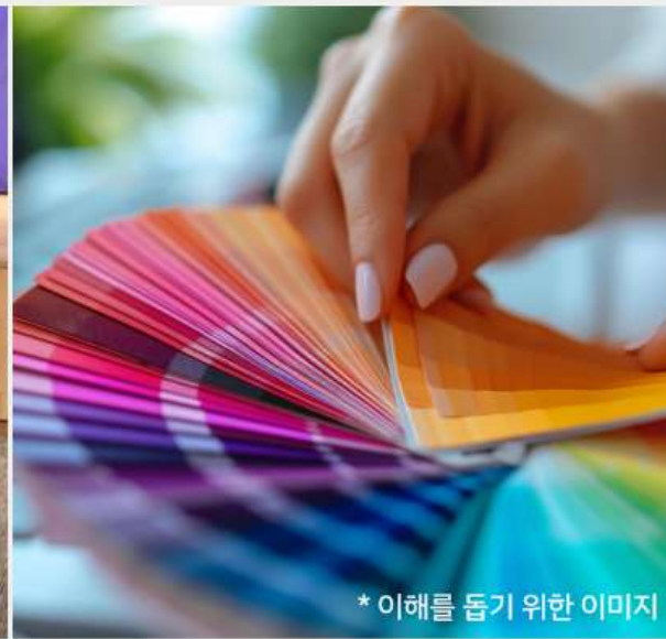
* 이해를 돕기 위한 이미지