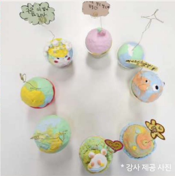
*강사 제공 사진