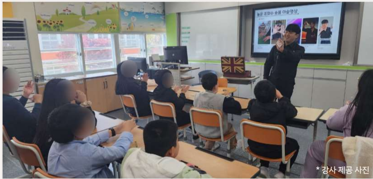
*강사 제공 사진