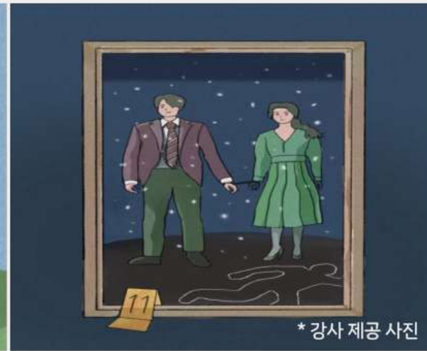
*강사 제공 사진