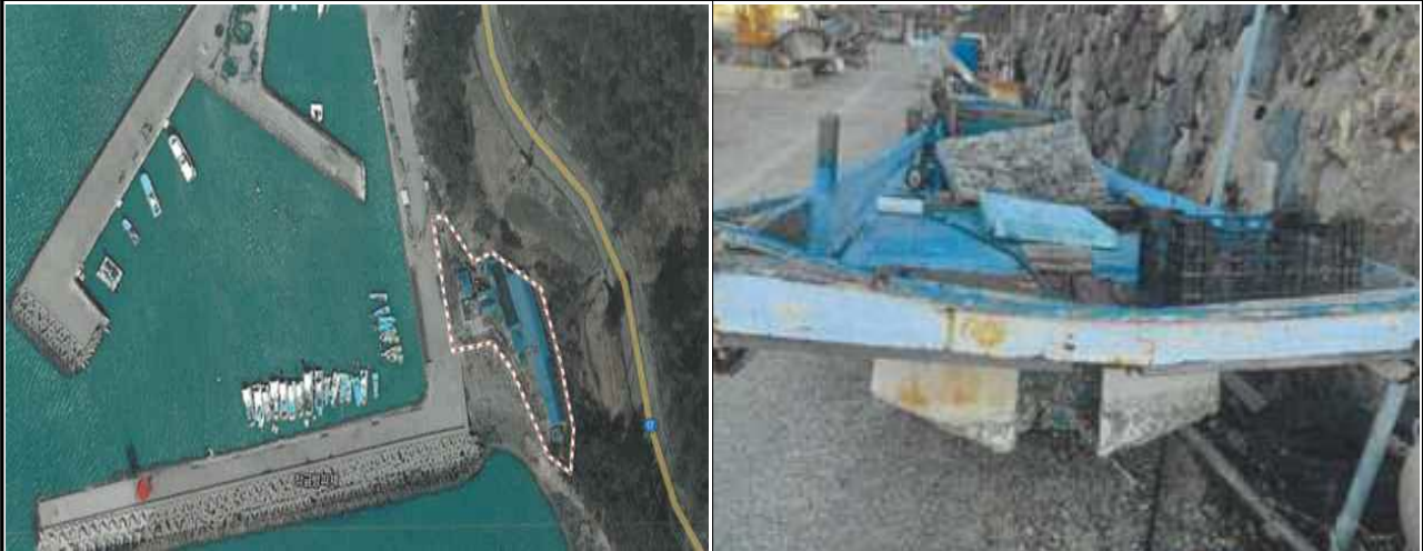
위치도 및 현장사진

위 방치선박은 어항의 효율적 이용을 저해하고 있으나 소유자가 불분명하여 어촌·어항법 제46조 및 같은 법 시행령 제41조항에 따라 위와 같이 직권으로 제거하고자 하오니, 이의가 있거나 문의사항이 있으신 분은 2025년 4월 3일까지 여수시 섬발전지원과(061-659-3991)로 연락하여 주시기 바랍니다.