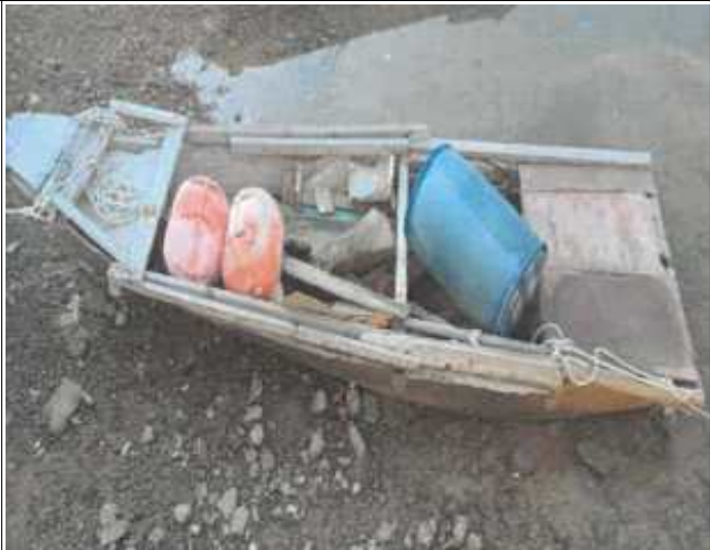
위치도 및 현장사진

위 방치선박은 어항의 효율적 이용을 저해하고 있으나 소유자가 불분명하여 어촌·어항법 제46조 및 같은 법 시행령 제41조항에 따라 위와 같이 직권으로 제거하고자 하오니, 이의가 있거나 문의사항이 있으신 분은 2025년 4월 3일까지 여수시 섬발전지원과(061-659-3991)로 연락하여 주시기 바랍니다.