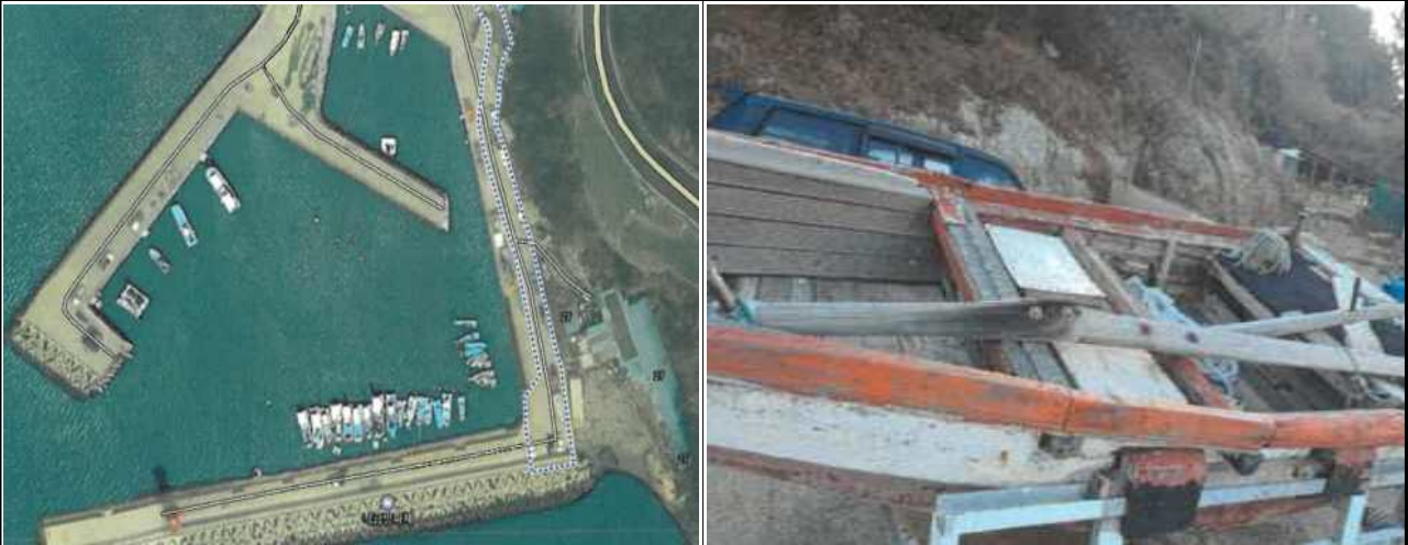
위치도 및 현장사진

위 방치선박은 어항의 효율적 이용을 저해하고 있으나 소유자가 불분명하여 어촌·어항법 제46조 및 같은 법 시행령 제41조항에 따라 위와 같이 직권으로 제거하고자 하오니, 이의가 있거나 문의사항이 있으신 분은 2025년 4월 3일까지 여수시 섬발전지원과(061-659-3991)로 연락하여 주시기 바랍니다.