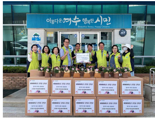
시전동 지역사회보장협의체 연합모금 후원자 감사패 전달식 행복이 넘치는 경로당 프로그램 / 어버이날 맞이 취약계층 물품 지원