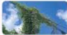
전기 시설 위험