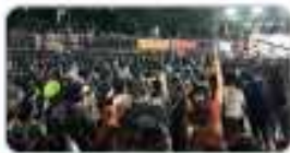
인파 밀집 우려