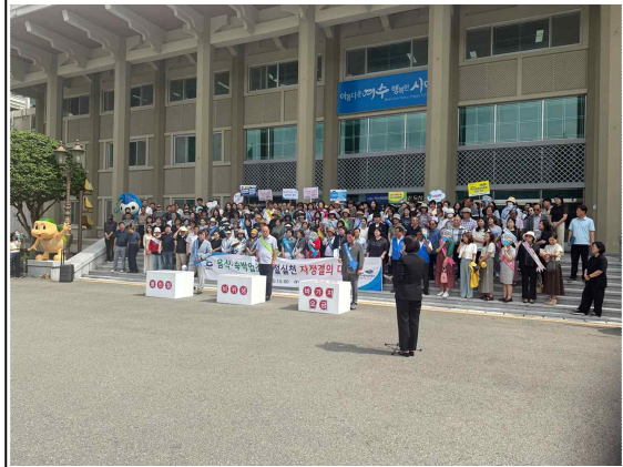
여수 르네상스 5대 실천 시민운동 추진 / 취약계층 사랑나눔 영양제 의료봉사 무더위 취약계층 후원품 전달 / 여수 르네상스 친절 캠페인 동참