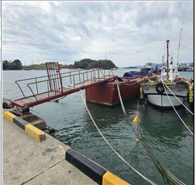
적치물 위치도 및 현장사진

위 장애물(적치물)은 어항의 효율적 이용을 저해하고 있으나 소유자가 이를 자진 제거하지 않아 어촌·어항법 제46조 및 같은 법 시행령 제41조항에 따라 위와 같이 직권으로 제거하고자 하오니, 이의가 있거나 문의사항이 있으신 분은 2025년 10월 10일까지 여수시 섬발전지원과(061-659-3991)로 연락하여 주시기 바랍니다.