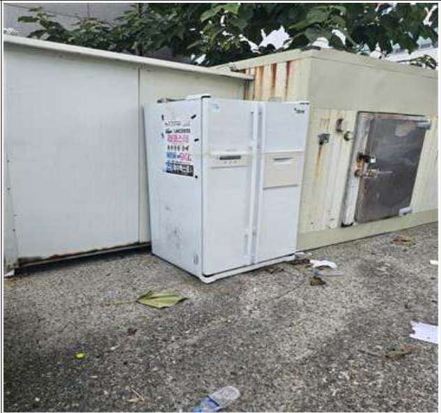
적치물 위치도 및 현장사진

위 적치물은 어항의 효율적 이용을 저해하고 있으나 소유자가 불분명하여 어촌·어항법 제46조 및 같은 법 시행령 제41조항에 따라 위와 같이 직권으로 제거하고자 하오니, 이의가 있거나 문의사항이 있으신 분은 2025년 10월 13일까지 여수시 섬발전지원과(061-659-3991)로 연락하여 주시기 바랍니다.