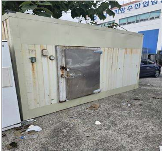
적치물 위치도 및 현장사진

위 적치물은 어항의 효율적 이용을 저해하고 있으나 소유자가 불분명하여 어촌·어항법 제46조 및 같은 법 시행령 제41조항에 따라 위와 같이 직권으로 제거하고자 하오니, 이의가 있거나 문의사항이 있으신 분은 2025년 10월 13일까지 여수시 섬발전지원과(061-659-3991)로 연락하여 주시기 바랍니다.