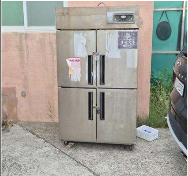
적치물 위치도 및 현장사진

위 적치물은 어항의 효율적 이용을 저해하고 있으나 소유자가 불분명하여 어촌·어항법 제46조 및 같은 법 시행령 제41조항에 따라 위와 같이 직권으로 제거하고자 하오니, 이의가 있거나 문의사항이 있으신 분은 2025년 10월 13일까지 여수시 섬발전지원과(061-659-3991)로 연락하여 주시기 바랍니다.