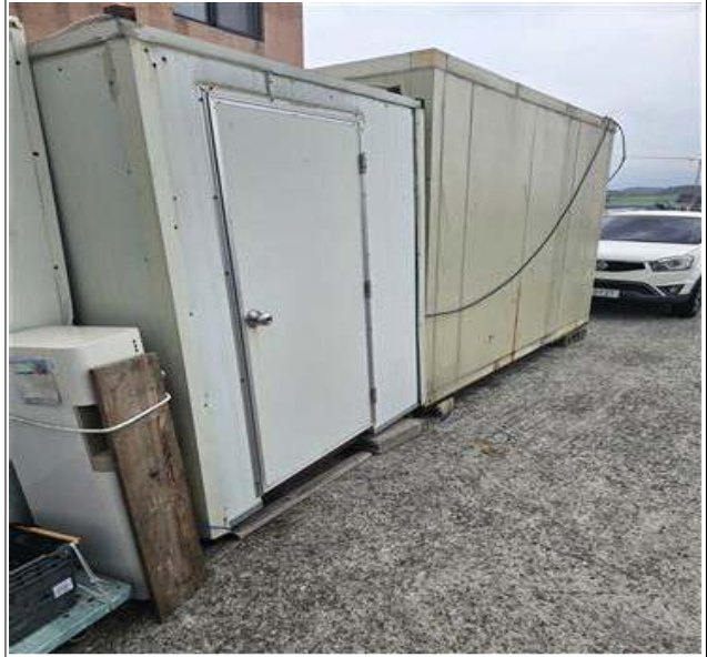
적치물 위치도 및 현장사진

위 적치물은 어항의 효율적 이용을 저해하고 있으나 소유자가 불분명하여 어촌·어항법 제46조 및 같은 법 시행령 제41조항에 따라 위와 같이 직권으로 제거하고자 하오니, 이의가 있거나 문의사항이 있으신 분은 2025년 10월 13일까지 여수시 섬발전지원과(061-659-3991)로 연락하여 주시기 바랍니다.