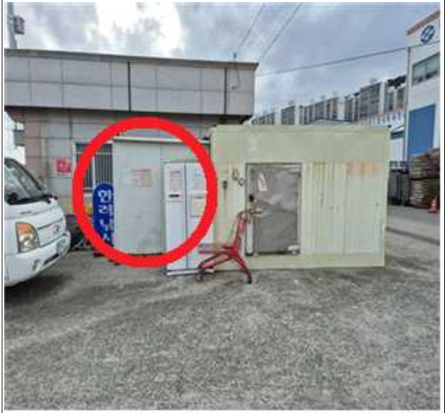
적치물 위치도 및 현장사진

위 적치물은 어항의 효율적 이용을 저해하고 있으나 소유자가 불분명하여 어촌·어항법 제46조 및 같은 법 시행령 제41조항에 따라 위와 같이 직권으로 제거하고자 하오니, 이의가 있거나 문의사항이 있으신 분은 2025년 10월 13일까지 여수시 섬발전지원과(061-659-3991)로 연락하여 주시기 바랍니다.