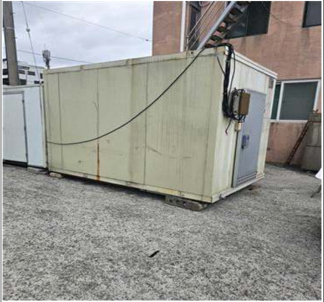
적치물 위치도 및 현장사진

위 적치물은 어항의 효율적 이용을 저해하고 있으나 소유자가 불분명하여 어촌·어항법 제46조 및 같은 법 시행령 제41조항에 따라 위와 같이 직권으로 제거하고자 하오니, 이의가 있거나 문의사항이 있으신 분은 2025년 10월 13일까지 여수시 섬발전지원과(061-659-3991)로 연락하여 주시기 바랍니다.