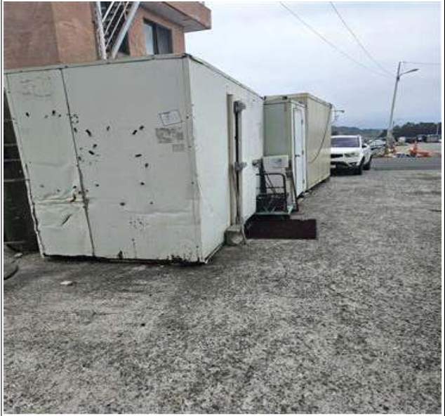
적치물 위치도 및 현장사진

위 적치물은 어항의 효율적 이용을 저해하고 있으나 소유자가 불분명하여 어촌·어항법 제46조 및 같은 법 시행령 제41조항에 따라 위와 같이 직권으로 제거하고자 하오니, 이의가 있거나 문의사항이 있으신 분은 2025년 10월 13일까지 여수시 섬발전지원과(061-659-3991)로 연락하여 주시기 바랍니다.