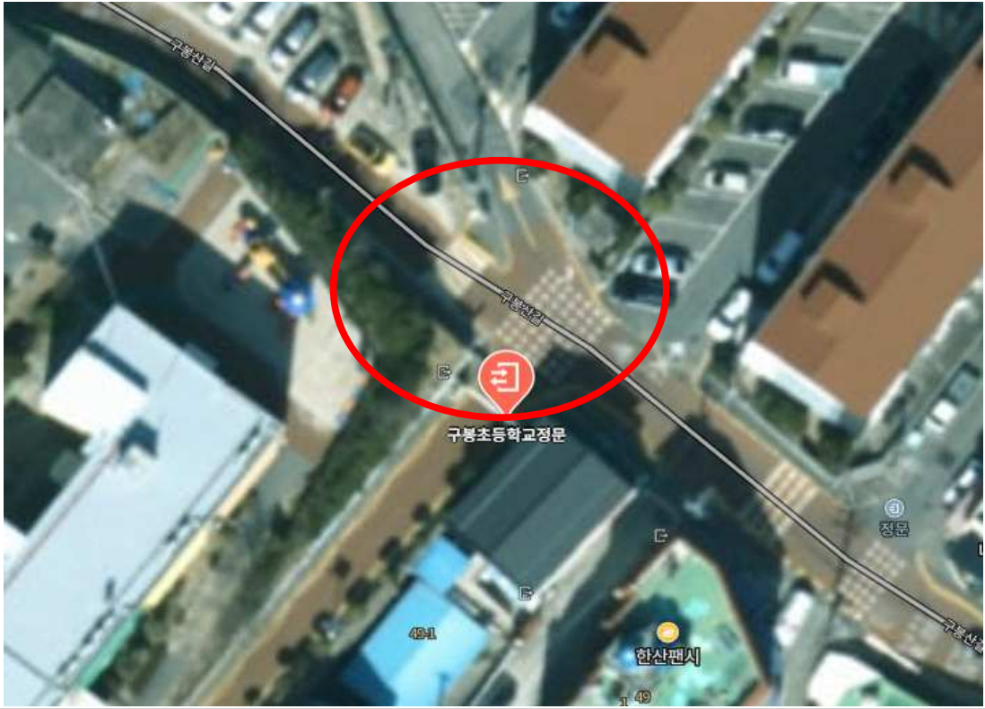
단속카메라 설치 위치(안)