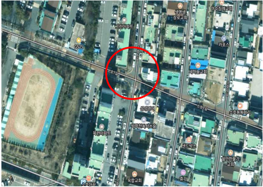
단속카메라 설치 위치(안)