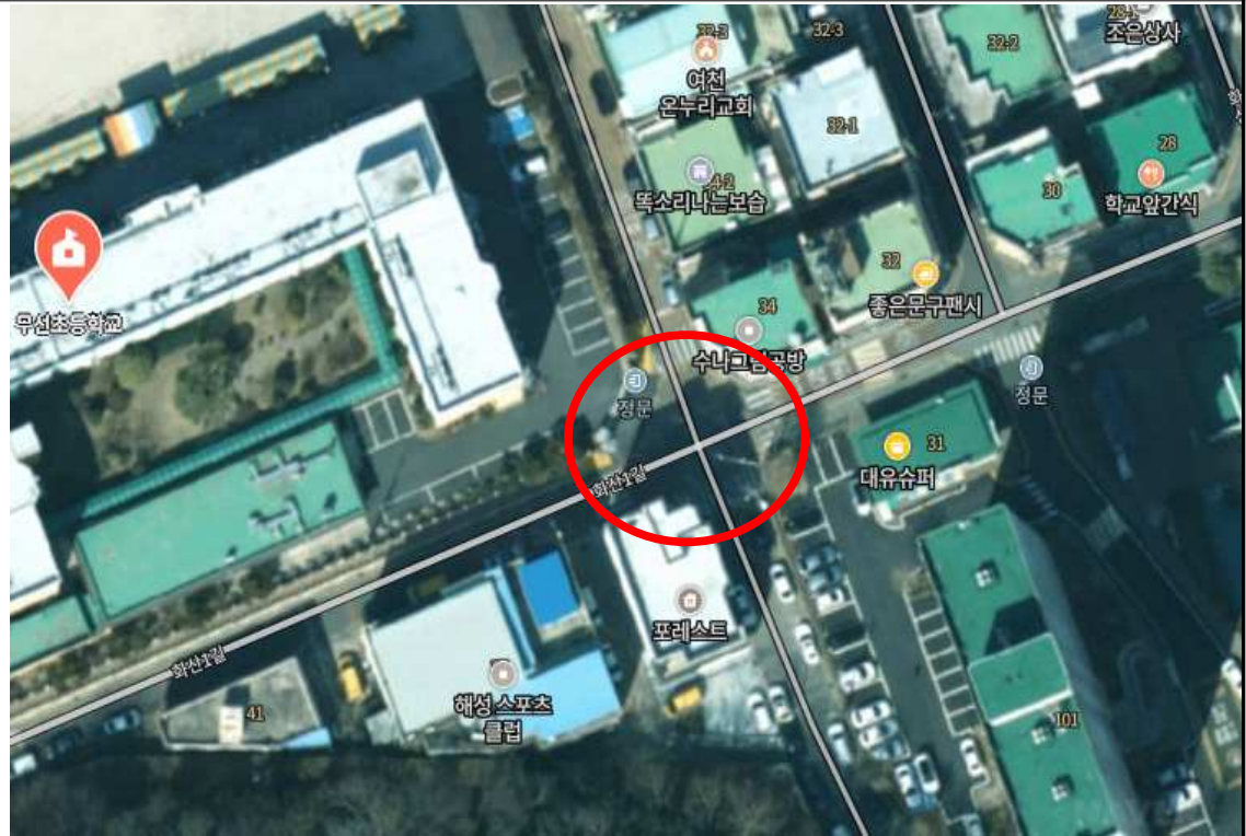
단속카메라 설치 위치(안)