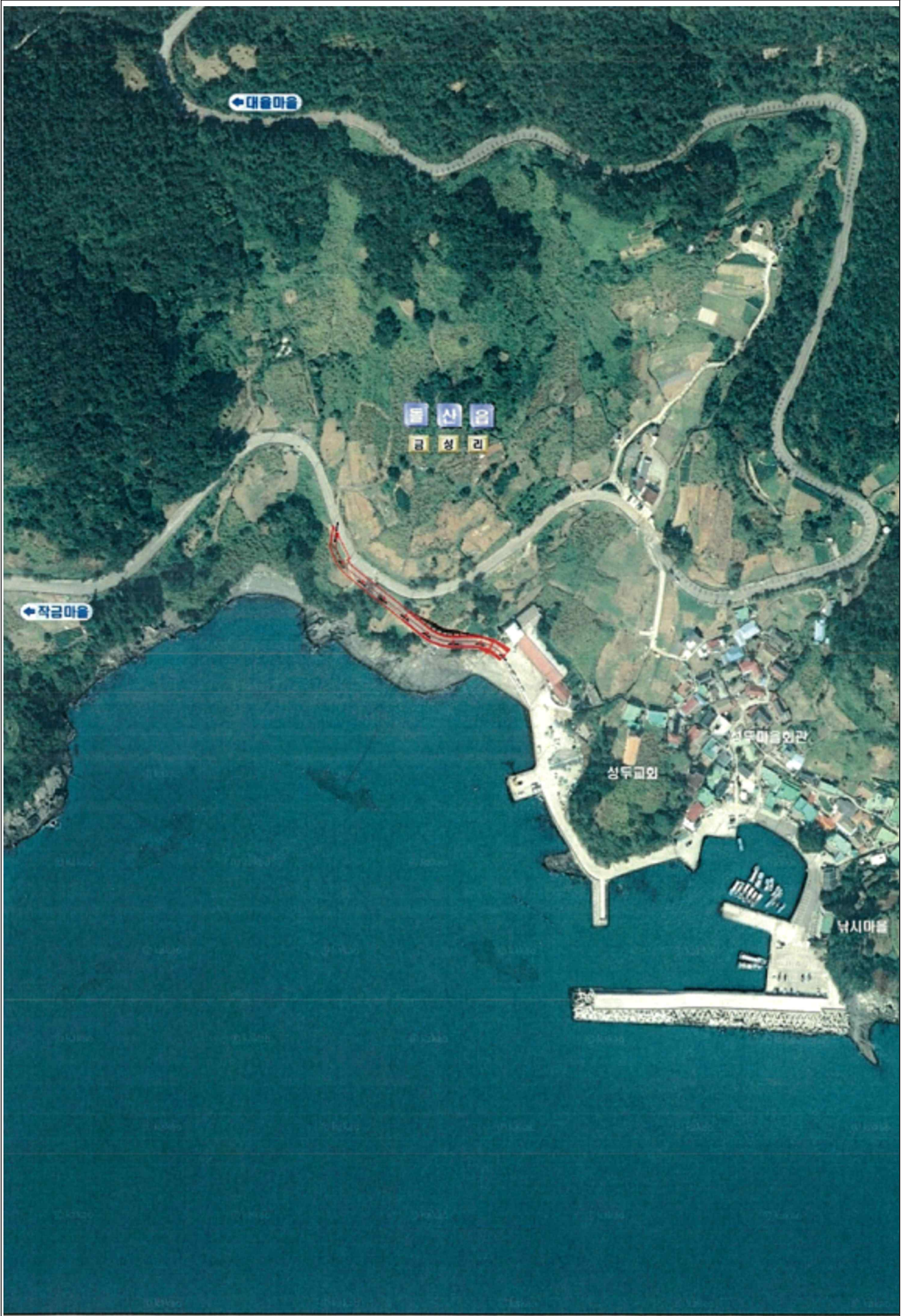
[붙임 3] 위치도