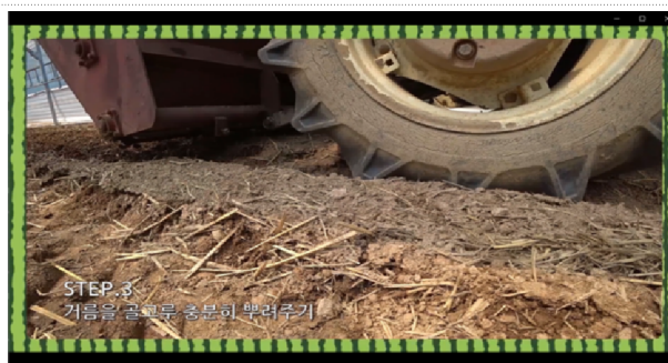
제출된 동영상 파일