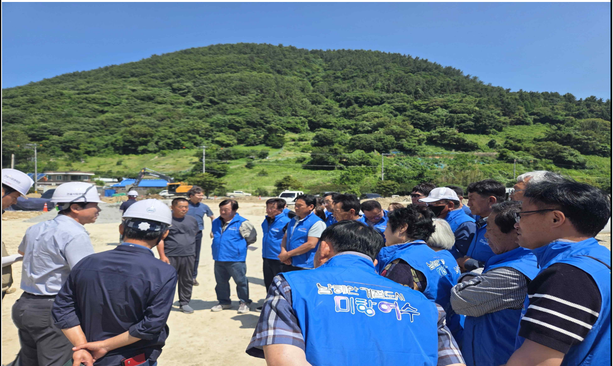
2026여수세계섬박람회 부행사장 이장단 현장 답사(6. 11.)