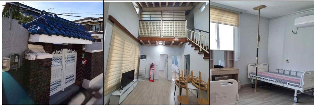
○ 포근휴(여자, 문수북10길 5-9)